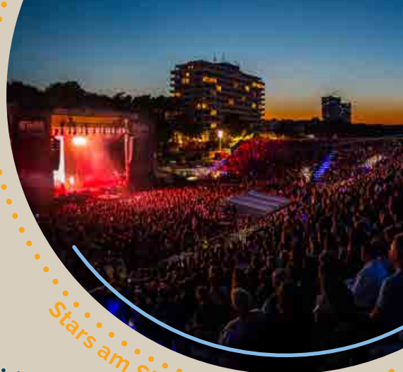
Stars am Strand